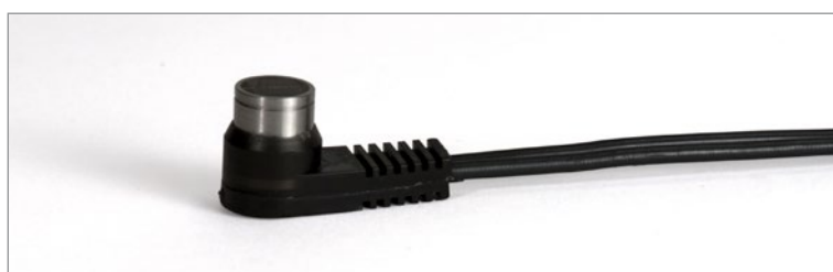
Новый преобразователь D7910 отличается высокой производительностью и доступен по цене.

В комплекте к толщиномеру 27MG прилагается экономичный отдельно-совмещенный преобразователь D7910, использующийся для измерения толщины многих корродированных объектов. Для измерения толщины слишком толстых или слишком тонких материалов, или труб малого диаметра, Olympus предлагает широкий ассортимент отдельно-совмещенных преобразователей. Преобразователи Olympus, совместимые с 27MG, имеют функцию автоматического распознавания; данная функция оптимизирует работу ПЭП, вызывая корректировку V-пути по умолчанию.